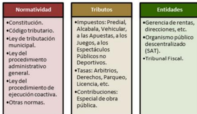
Sistema Tributario Peruano